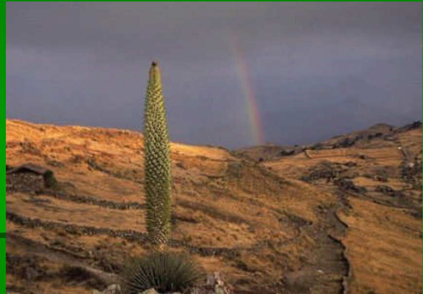
Santuario Nacional de Calipuy