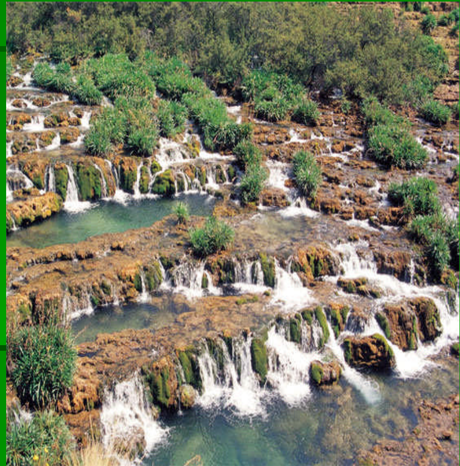
Reserva paisajística Nor Yauyos Cochas