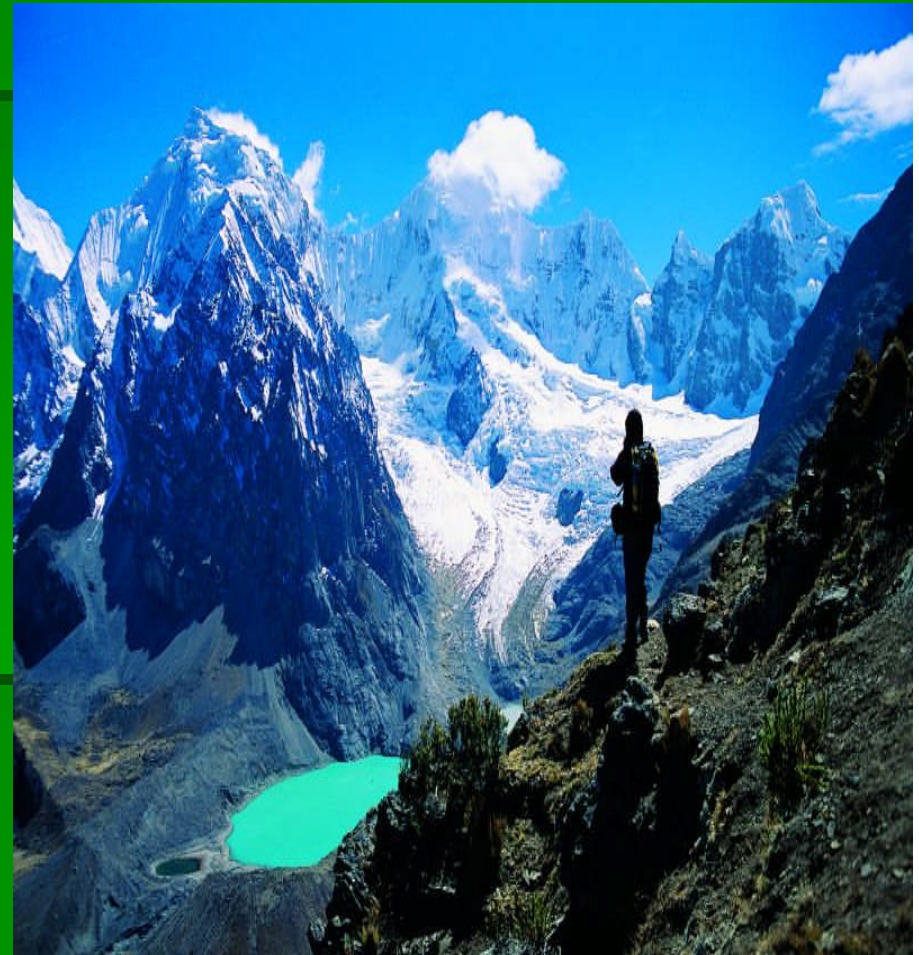
Parque Nacional del Huascarán