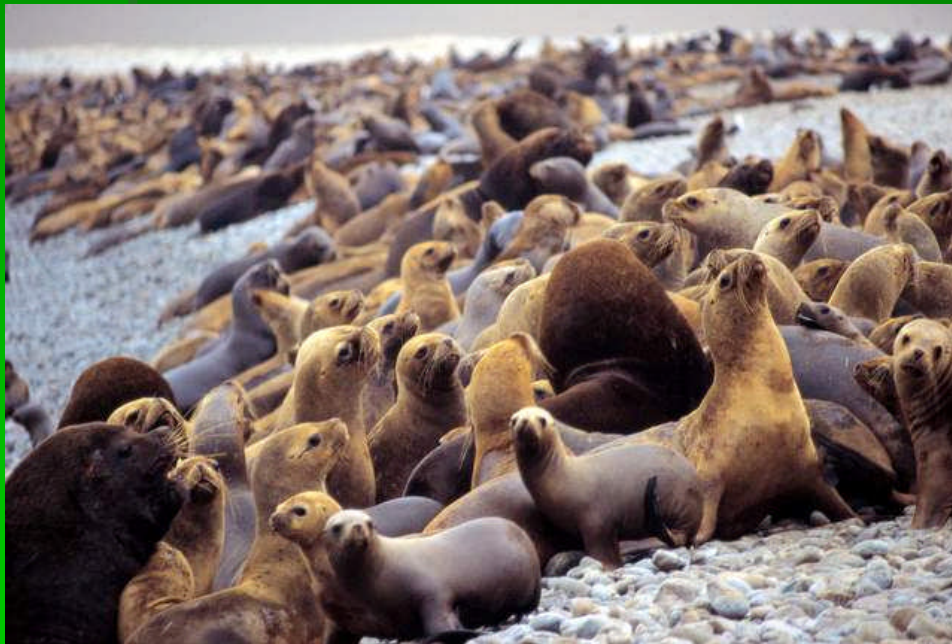
Reserva Nacional de Paracas