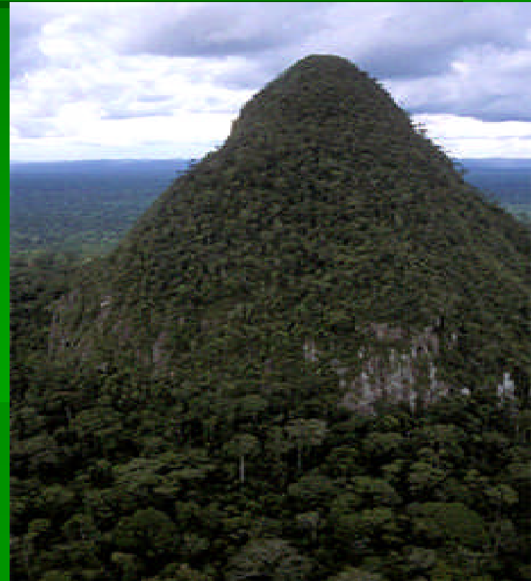
Zona Reservada Sierra del Divisor