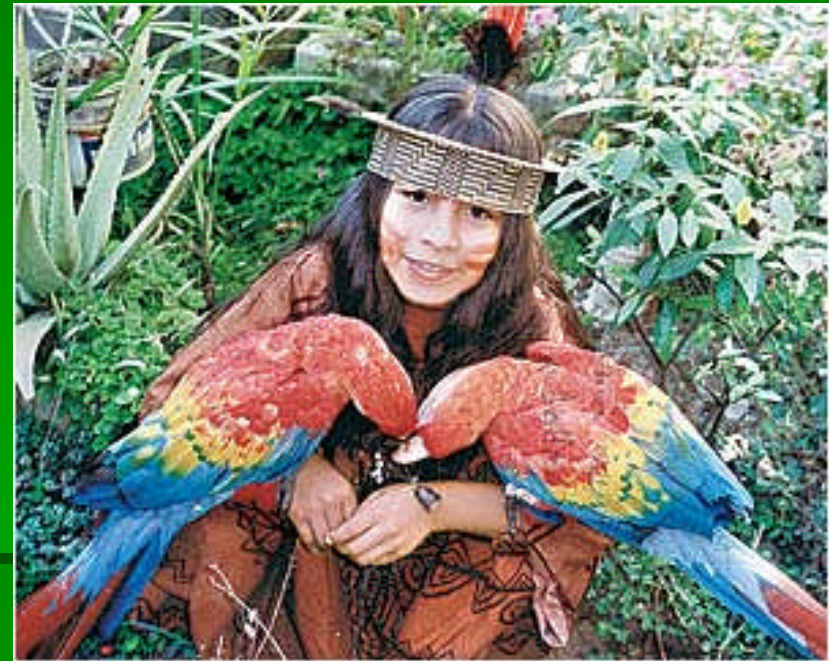
Reserva comunal de los Machiguenga