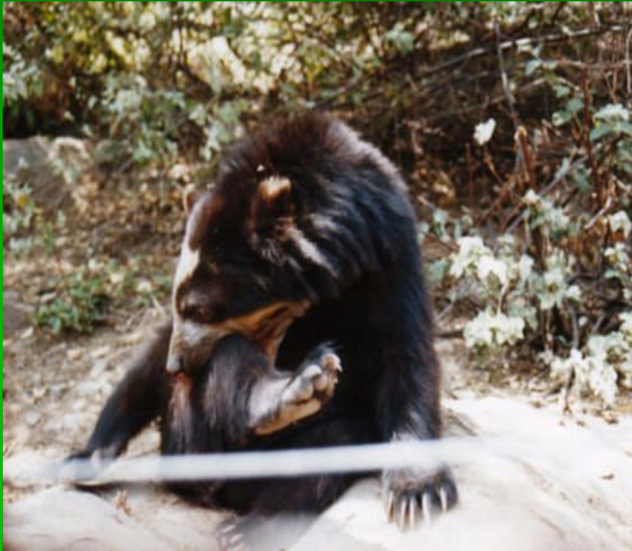
Oso de Anteojos de Laquipampa